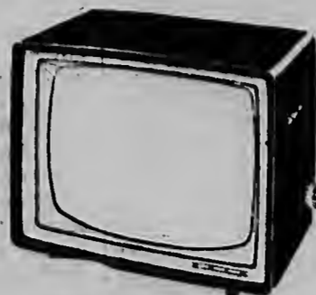
19TX335A Transportable TV ontvanger met 48 cm beeldbuis. Het apparaat heeft dezelfde automatische features als de grotere tafelformaten, t.w. DUBBELE automatische synchronisatie, automatische beeldhoogte- en beeldbreedte-instelling an MemoMatic Fijnafstemming. Bedieningsknoppen eenvoudig geplaatst in de rechter handgreep. Mooie, hoogglans houten kast van geselecteerde houtsoorten.